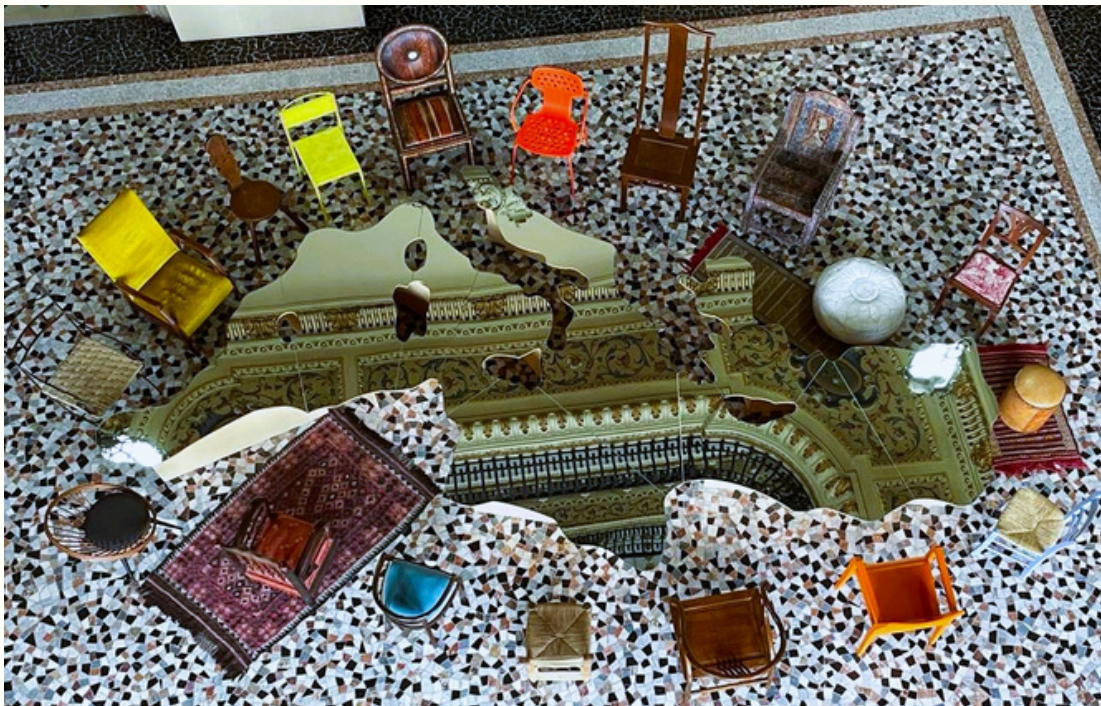
Tavolo Love Difference - Michelangelo Pistoletto

Hotel Perla del Golfo Terrasini, PALERMO