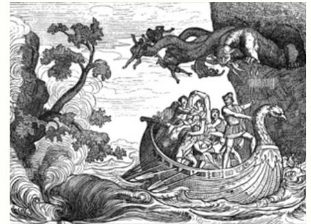
Ulisse e i suoi uomini lottano contro Scilla, illustrazione dell'Odissea, 1880